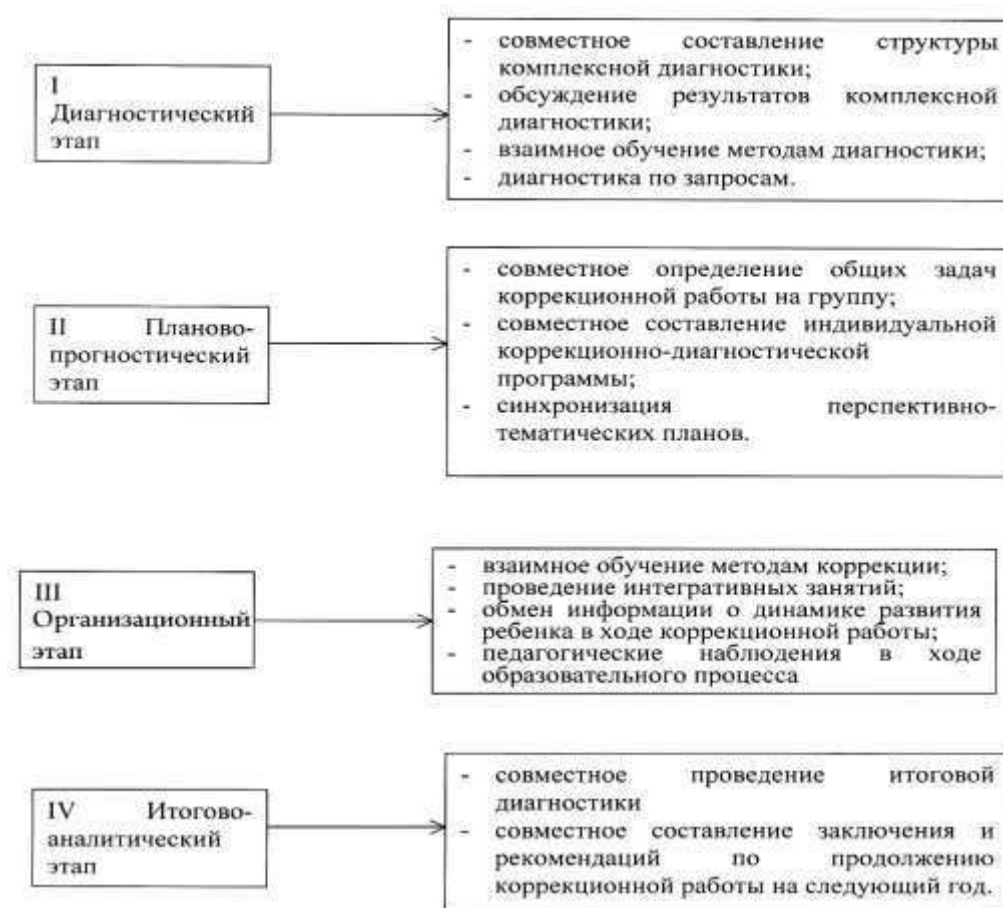
Рисунок 3. Система взаимодействия специалистов в процессе диагностики.

Данные комплексной диагностики каждого воспитанника заносятся в «Карту психолого-педагогического и медико-социального развития ребенка», в которой проектируется разработка Индивидуального коррекционного маршрута развития, в котором систематизируются все наблюдения и рекомендации специалистов, динамика развития ребенка.